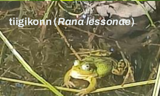
tiigikonn ( Rana lessonae )