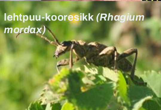
lehtpuu-koosesikk ( Rhagium mordax )