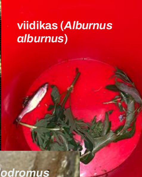
viidikas ( Alburnus alburnus )