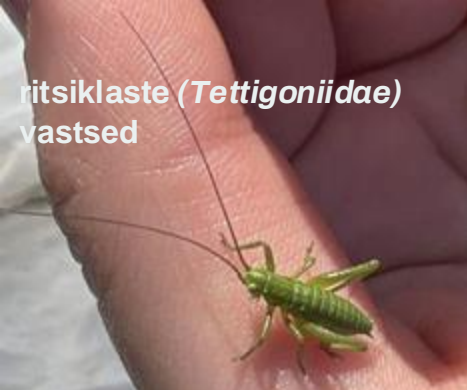
ritsiklaste ( Tettigoniidae ) vastsed