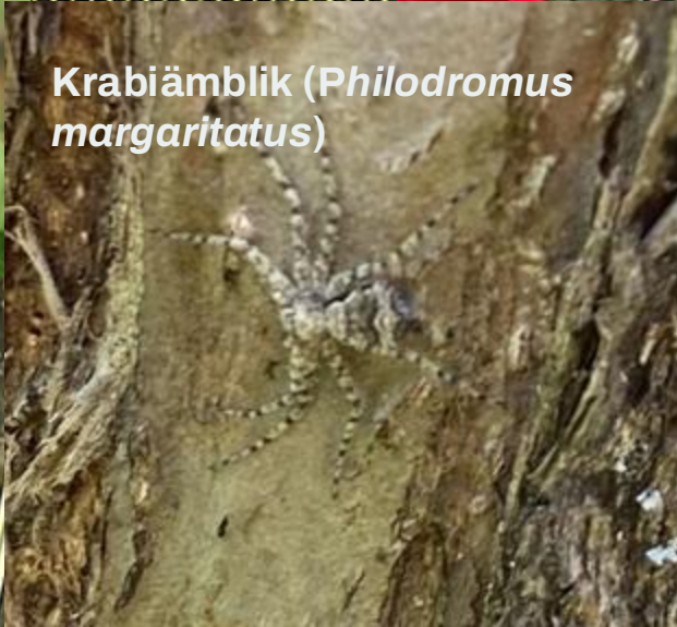
Krabiämblik ( Philodromus margaritatus )