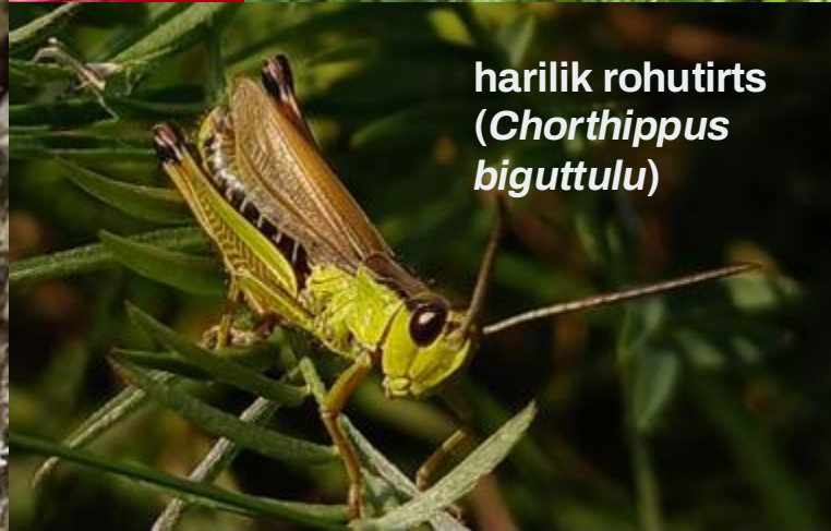
harilik rohutirts ( Chorthippus biguttulu )