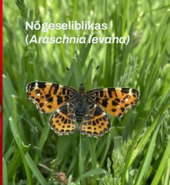
Nõgeseliblikas ( Araschnia levana )