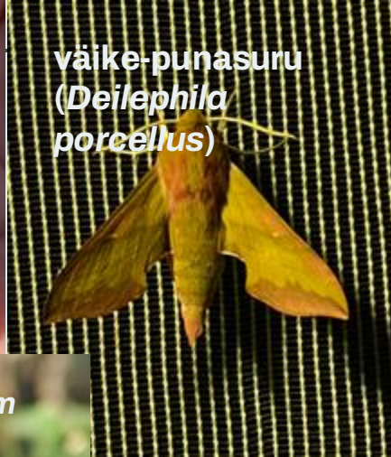
väike-punasuru ( Deilephila porcellus )